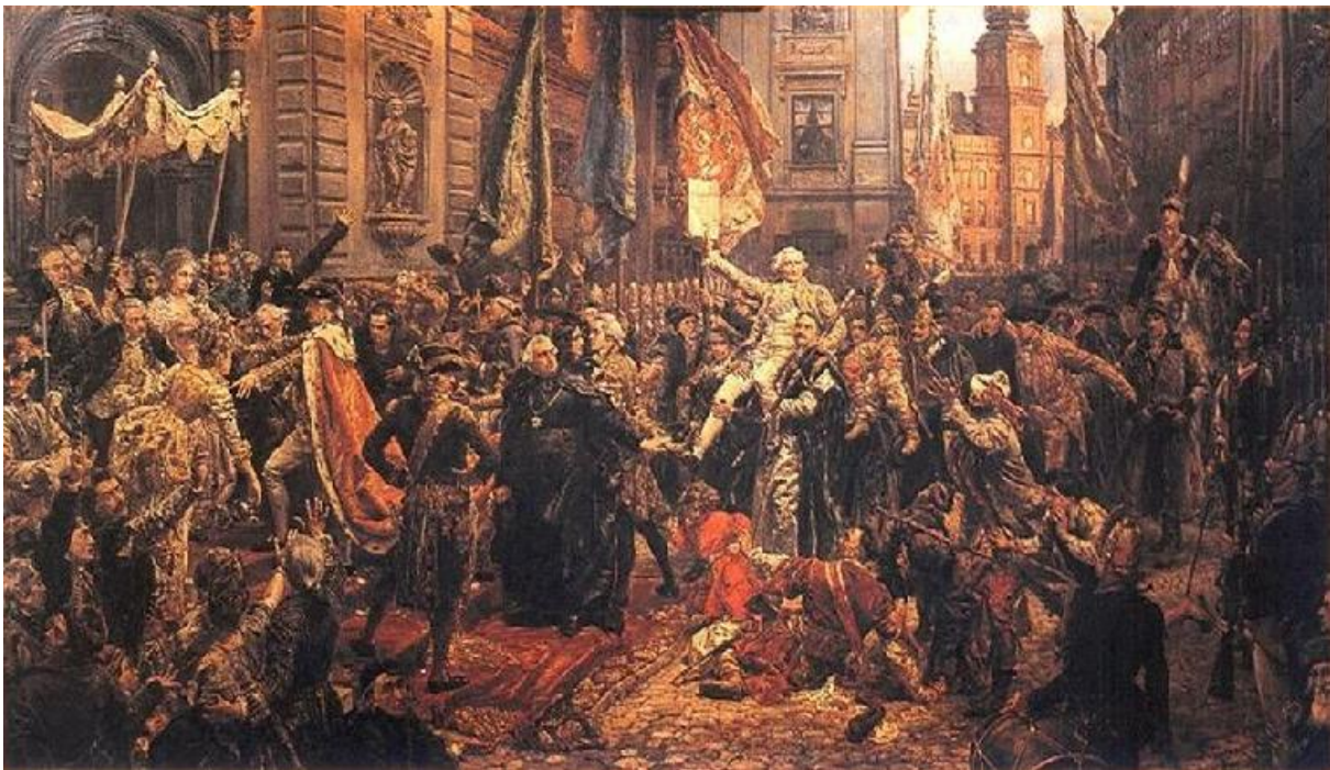
Jan Matejko „Konstytucja 3 Maja”