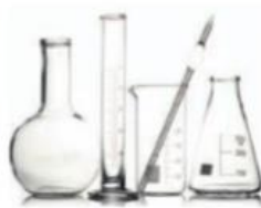
Produkcja szkła laboratoryjnego

Pozdrawiam Was serdecznie i życzę dużo zdrowia!