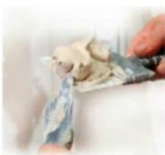
Produkcja cementu i zapraw murarskich