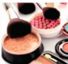
Produkcja kosmetyków, np. pudrów

5 Napisz wzory sumaryczne i nazwy systematyczne tlenków, których zastosowania przedstawiono na fotografiach.